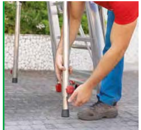
Stabilizzatore telescopico. Telescopic stabilizer.