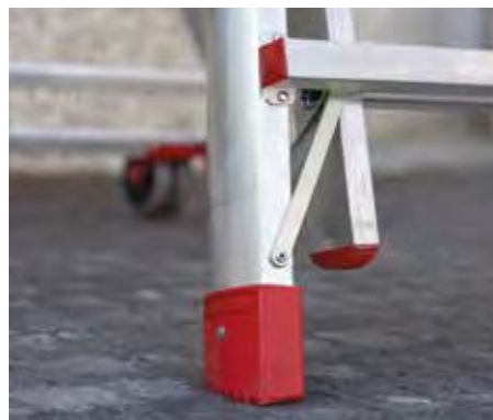
Maggiore stabilità con le traverse di rinforzo agli angoli. Increased stability with reinforced crossbars on the corners.