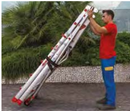
Ingombro ridotto per un facile trasporto. Compact size for easy transportation.