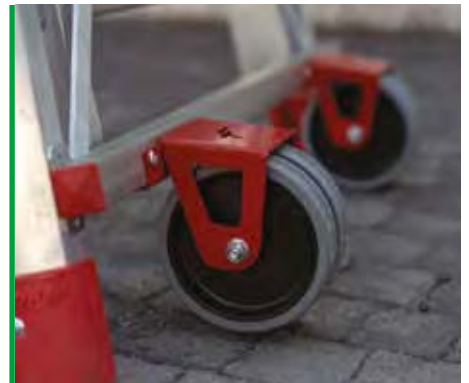
Stabilità assoluta in fase di lavoro e spostamento comodo e rapido. Absolute stability while working and rapid and easy displacement.